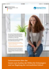
FLYER Artikelnr.: 4FL122