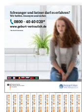
PLAKAT DIN A4 Artikelnr.: 4SO121